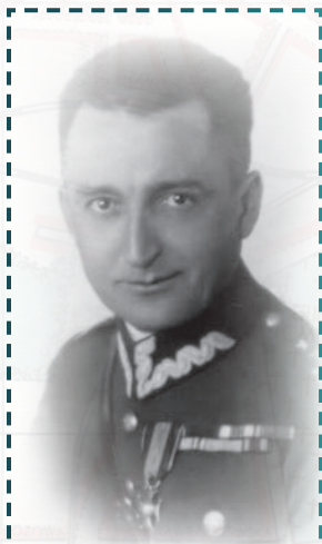
Dowódca Kierownictwa Dywersji KG AK płk August Emil Fieldorf „Nil”