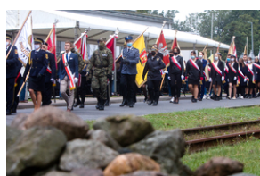
Uroczystości pod pomnikiem „Tędy przeszła Warszawa” na terenie byłego obozu Durchgangslager 121 w Pruszkowie – 2 października 2020.