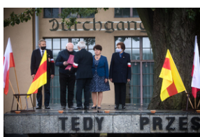
Uroczystości pod pomnikiem „Tędy przeszła Warszawa” na terenie byłego obozu Durchgangslager 121 w Pruszkowie – 2