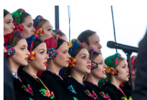
Uroczystości pod pomnikiem „Tędy przeszła Warszawa” na terenie byłego obozu Durchgangslager 121 w Pruszkowie – 2