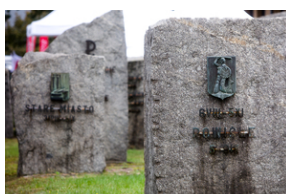
Uroczystości pod pomnikiem „Tędy przeszła Warszawa” na terenie byłego obozu Durchgangslager 121 w Pruszkowie – 2 października 2020.