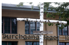
Uroczystości pod pomnikiem „Tędy przeszła Warszawa” na terenie byłego obozu Durchgangslager 121 w Pruszkowie – 2 października 2020.

gdzie uroczycie odsłonięta została tablica upamiętniająca wszystkich zabitych i zmarłych więźniów obozu Durchgangslager 121, którzy w okresie od 7 sierpnia 1944 r. do 16 stycznia 1945 r. zostali pochowani w zbiorowych, bezimiennych mogiłach na Cmentarzu Żbikowskim. Tablicę, ufundowaną przez Instytut Pamięci Narodowej, umieszczono przy głównej bramie cmentarza od ul. Domaniewskiej.