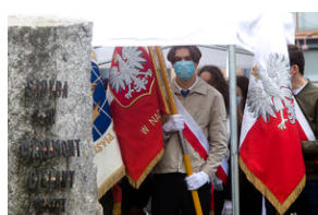
Uroczystości pod pomnikiem „Tędy przeszła Warszawa” na terenie byłego obozu Durchgangslager 121 w Pruszkowie – 2