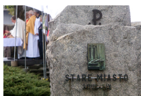
Uroczystości pod pomnikiem „Tędy przeszła Warszawa” na terenie byłego obozu Durchgangslager 121 w Pruszkowie – 2 października 2020.