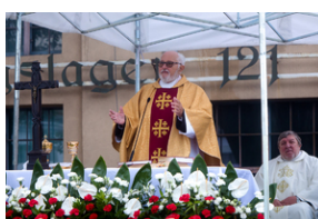
Uroczystości pod pomnikiem „Tędy przeszła Warszawa” na terenie byłego obozu Durchgangslager 121 w Pruszkowie – 2 października 2020.