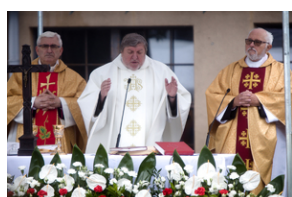
Uroczystości pod pomnikiem „Tędy przeszła Warszawa” na terenie byłego obozu Durchgangslager 121 w Pruszkowie – 2 października 2020.