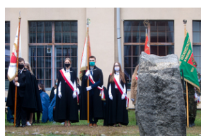
Uroczystości pod pomnikiem „Tędy przeszła Warszawa” na terenie byłego obozu Durchgangslager 121 w Pruszkowie – 2 października 2020.