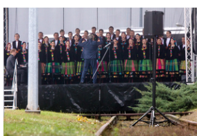
Uroczystości pod pomnikiem „Tędy przeszła Warszawa” na terenie byłego obozu Durchgangslager 121 w Pruszkowie – 2 października 2020.