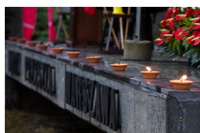
Uroczystości pod pomnikiem „Tędy przeszła Warszawa” na terenie byłego obozu Durchgangslager 121 w Pruszkowie – 2 października 2020.