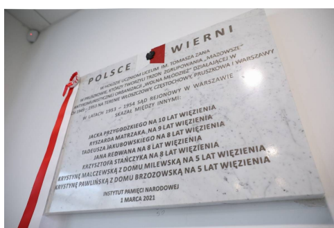
Tablica upamiętniająca antykomunistyczną organizację młodzieżową „Wolna Młodzież” w Pruszkowie.