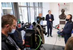
Odsłonięcie tablicy upamiętniającej antykomunistyczną organizację młodzieżową „Wolna Młodzież” w Pruszkowie - 1 marca 2021.