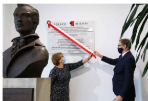
Odsłonięcie tablicy upamiętniającej antykomunistyczną organizację młodzieżową „Wolna Młodzież” w Pruszkowie - 1 marca 2021.