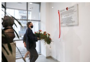
Odsłonięcie tablicy upamiętniającej antykomunistyczną organizację młodzieżową „Wolna Młodzież” w Pruszkowie - 1 marca 2021.