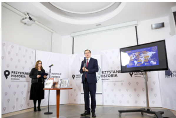
Narodowy Dzień Pamięci Polaków ratujących Żydów pod okupacją niemiecką. Konferencja prasowa IPN – 23 marca 2021.

Swymi czynami wzniesli się na wyżyny człowieczeństwa, jednocześnie pozostawiając nadzieję, że dobro w człowieku zawsze zwycięży nad złem, nawet kiedy za tym złem stoją potężne siły. Niekiedy cena zwycięstwa dobra nad złem jest bardzo wysoka. Oni tę najwyższą