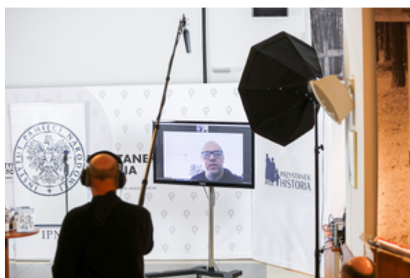
Narodowy Dzień Pamięci Polaków ratujących Żydów pod okupacją niemiecką. Konferencja prasowa IPN – 23 marca 2021.