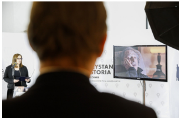
Narodowy Dzień Pamięci Polaków ratujących Żydów pod okupacją niemiecką. Konferencja prasowa IPN – 23 marca 2021.

Film dokumentalny „Polmission. Tajemnice paszportów”, którego koproducentem (wraz z TVP i PISF) jest Instytut Pamięci Narodowej, przedstawia wątek jednej z największych i najbardziej zagadkowych akcji ratowania Żydów podczas II wojny światowej. Obraz w reżyserii Jacka Papisa jest kontynuacją filmu „Paszporty Paragwaju” (emisja w TVP Dokument 24.03 o 21:10), opowiada o dalszych losach ratowanych dzięki działalności polskiego rządu RP na Uchodźstwie, polskiej dyplomacji i polskiego wywiadu, we współpracy z organizacjami żydowskimi. W ramach działań tzw. „Grupy Ładosia” udało się uratować od zagłady około 3000 Żydów, wystawiając im fałszywie wypełnione paszporty krajów latynoamerykańskich, m.in. Paragwaju.