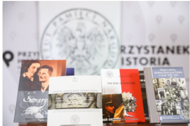
Narodowy Dzień Pamięci Polaków ratujących Żydów pod okupacją niemiecką. Konferencja prasowa IPN – 23 marca 2021.

Film dokumentalny „Polmission. Tajemnice paszportów”, którego koproducentem (wraz z TVP i PISF) jest Instytut Pamięci Narodowej, przedstawia wątek jednej z największych i najbardziej zagadkowych akcji ratowania Żydów podczas II wojny światowej. Obraz w reżyserii Jacka Papisa jest kontynuacją filmu „Paszporty Paragwaju” (emisja w TVP Dokument 24.03 o 21:10), opowiada o dalszych losach ratowanych dzięki działalności polskiego rządu RP na Uchodźstwie, polskiej dyplomacji i polskiego wywiadu, we współpracy z organizacjami żydowskimi. W ramach działań tzw. „Grupy Ładosia” udało się uratować od zagłady około 3000 Żydów, wystawiając im fałszywie wypełnione paszporty krajów latynoamerykańskich, m.in. Paragwaju.