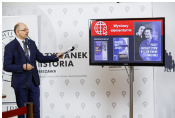
Zastępca Prezesa Instytutu Pamięci Narodowej dr Mateusz Szpytma. Konferencja prasowa IPN – 23 marca 2021.

Retransmisja na kanale IPNtv (jęz. polski)