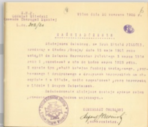
↑ Zaświadczenie o działalności harcerskiej Witolda Pileckiego 📍 CAW