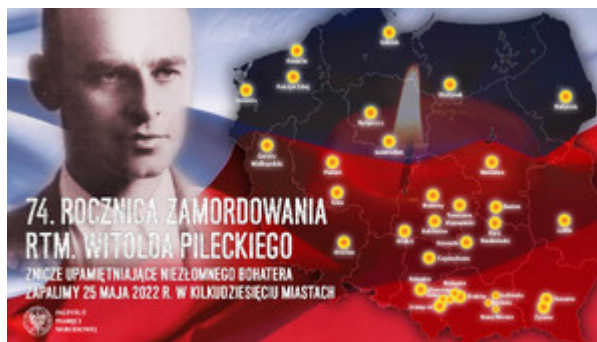
Znicze pamięci w godzinę śmierci rotmistrza Witolda Pileckiego - 25 maja 2022

W 1944 r. walczył w powstaniu warszawskim, w zgrupowaniu Chrobry II. Od 1945 r. służył w 2. Korpusie Polskim we Włoszech, skąd - decyzją gen. Władysława Andersa - wrócił do Polski, by odtworzyć rozbite po działaniach wojennych struktury wywiadowcze, działające dla Rządu RP na Uchodźstwie. Został aresztowany w maju 1947 r., osadzony w areszcie śledczym przy ul. Rakowieckiej w Warszawie i poddany okrutnemu śledztwu. Mimo tortur do końca zachował żołnierską postawę. Pozostał wierny dewizie: Bóg, Honor, Ojczyzna.