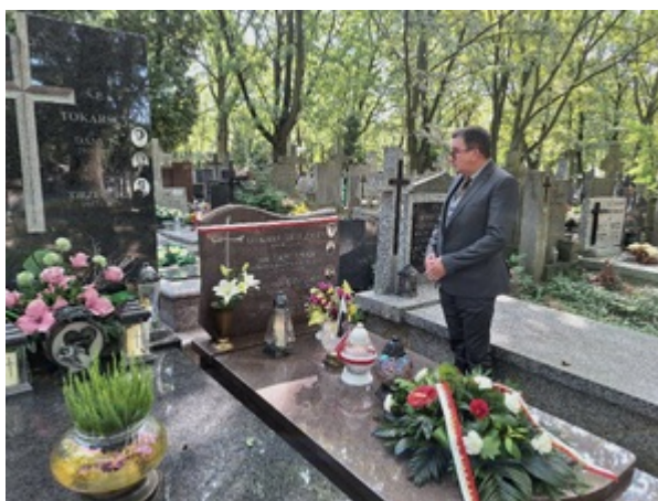
pamiętamy o Westerplatte

Porucznik rezerwy Wojska Polskiego. W Wojskowej Składnicy Tranzytowej od sierpnia 1934 r. odpowiadał za budowę i działanie infrastruktury technicznej. W czasie obrony Westerplatte, pełniąc funkcję adiutanta mjr. Henryka Sucharskiego, był jedną z jego najbardziej zaufanych osób. Po kapitulacji Westerplatte trafił do niewoli niemieckiej, którą przebył w Oflagu II C Woldenberg. Odznaczony m.in. Srebrnym Krzyżem Virtuti Militari.