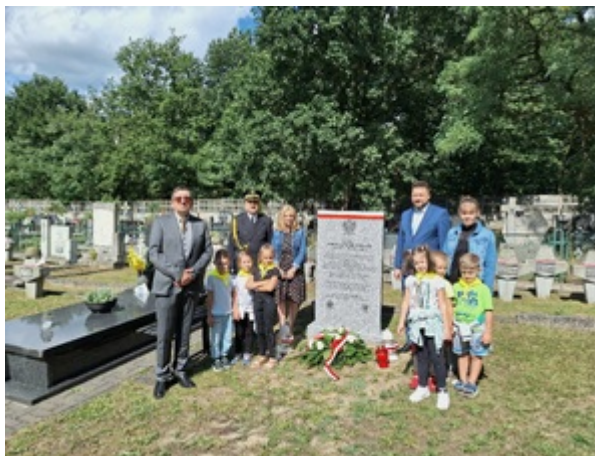
pamiętamy o Westerplatte (Legionowo)