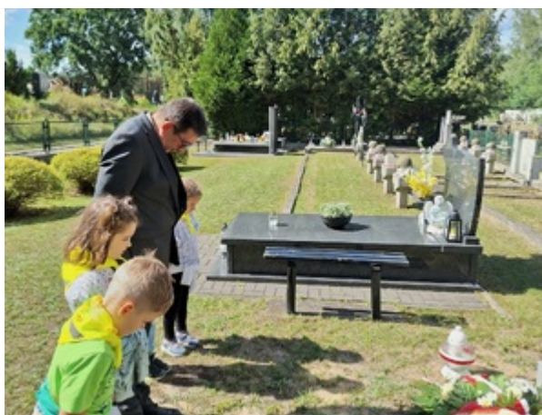
pamiętamy o Westerplatte (Legionowo)

Chorąży Wojska Polskiego. Na Westerplatte od końca marca 1939 r. W chwili niemieckiego ataku na Westerplatte pełnił funkcję zastępcy dowódcy placówki „Prom”, a następnie przejął jej dowodzenie po rannym por. Leonie Pająku. Po odwróceniu żołnierzy do Wartowni nr 1 kierował nią aż do kapitulacji. Wzięty do niewoli trafił do Oflagu II C Woldenberg, gdzie spędził całą wojnę. Odznaczony m.in. Srebrnym Krzyżem