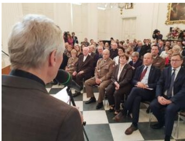
Wręczenie nagród Instytutu Pamięci Narodowej „Semper Fidelis” – Warszawa, 22 października 2019.