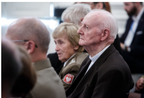
Wręczenie nagród Instytutu Pamięci Narodowej „Semper Fidelis” – Warszawa, 22 października 2019.