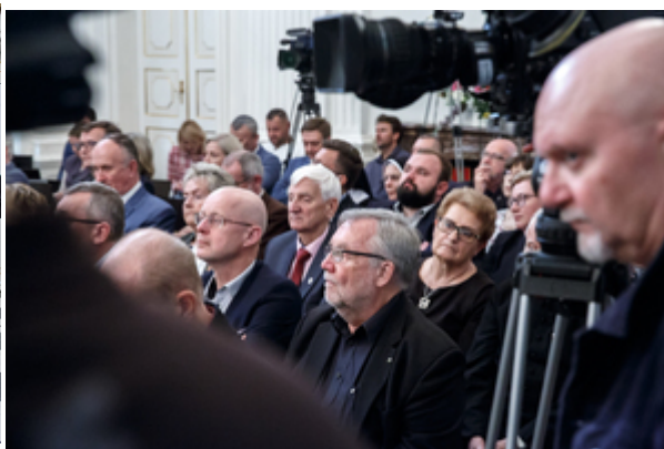
Wręczenie nagród Instytutu Pamięci Narodowej „Semper Fidelis” – Warszawa, 22 października 2019.

Z upływem lat odchodzi ostatnie pokolenie tych, którzy pamiętają świat Kresów Wschodnich Rzeczypospolitej; z roku na rok zaciera się indywidualna pamięć o polskim Lwowie, Stanisławowie czy Wilnie. Pamięć, którą nota bene w czasach komunistycznego zakłamania skazano na nieistnienie. Masowe przesiedlenia obywateli II Rzeczypospolitej, zmuszonych do opuszczenia ojcowizny i osiedlenia się na terenach w większości przypadków należących przed wojną do państwa niemieckiego, przez prawie pół wieku określano mianem „repatriacji”, semantycznie tożsamym z „powrotem do ziemi ojców”. Miało to swoje uzasadnienie polityczne i propagandowe, jednak nie odpowiadało faktycznej sytuacji, w jakiej znaleźli się przesiedlani. Przybywali oni najczęściej na ziemi obce im i nieznane.