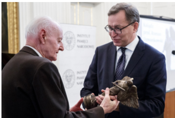
Ks. Roman Dzwonkowski i prezes IPN Jarosław Szarek – Warszawa, 22 października 2019. Fot. Sławek Kasper (IPN)

List od marszałka Senatu Stanisława Karczewskiego odczytał senator Konstanty Radziwiłł – Warszawa, 22 października 2019. Fot. Sławek Kasper (IPN)