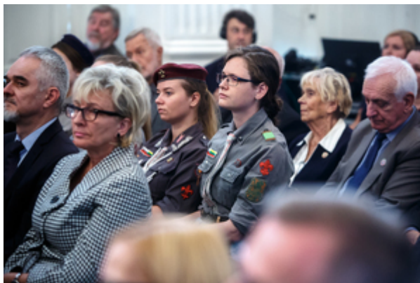
Wręczenie nagród Instytutu Pamięci Narodowej „Semper Fidelis” – Warszawa, 22 października 2019.

List od Marszałka Senatu Stanisława Karczewskiego odczytał senator Konstanty Radziwiłł. „Dzisiejsza uroczystość jest nie tylko okazją do wręczenia honorowych wyróżnień, jest także sposobnością