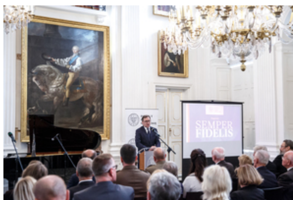
Wystąpienie prezesa IPN Jarosława Szarka podczas wręczenia nagród Instytutu Pamięci Narodowej „Semper Fidelis” – Warszawa, 22 października 2019.

w Sali Białej Muzeum Pałacu Króla Jana III w Wilanowie Instytut Pamięci Narodowej po raz pierwszy wręczył nagrody „Semper Fidelis”. Otrzymali je: