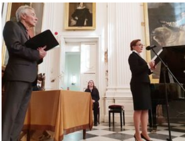
Wręczenie nagród Instytutu Pamięci Narodowej „Semper Fidelis” – Warszawa, 22 października 2019.