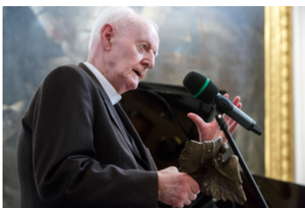
Ks. Roman Dzwonkowski – laureat nagrody Instytutu Pamięci Narodowej „Semper Fidelis” – Warszawa, 22 października 2019.