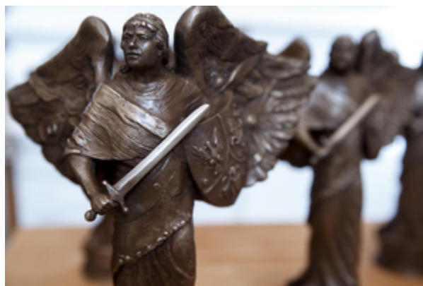
Statuetka „Semper Fidelis” – Warszawa, 22 października 2019.