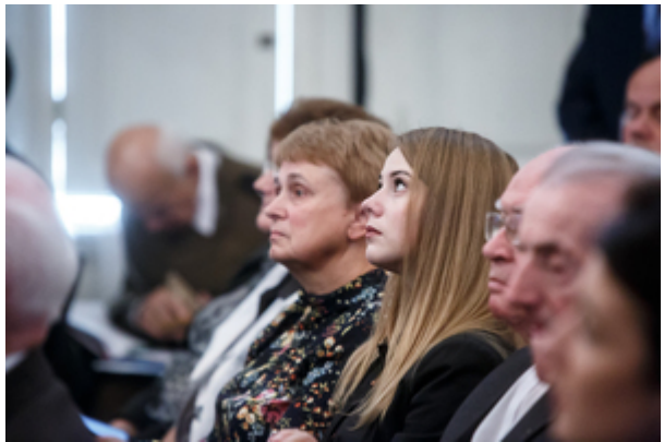
Wręczenie nagród Instytutu Pamięci Narodowej „Semper Fidelis” - Warszawa, 22 października 2019.