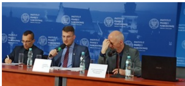
Ogólnopolska konferencja naukowa „II RP: cienie i blaski. Próba bilansu z perspektywy stulecia” – Warszawa, 8 listopada 2022