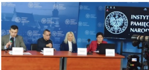
Ogólnopolska konferencja naukowa „II RP: cienie i blaski. Próba bilansu z perspektywy stulecia” - Warszawa, 8 listopada 2022