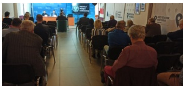
Ogólnopolska konferencja naukowa „II RP: cienie i blaski. Próba bilansu z perspektywy stulecia” – Warszawa, 8 listopada 2022