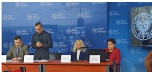
Ogólnopolska konferencja naukowa „II RP: cienie i blaski. Próba bilansu z perspektywy stulecia” - Warszawa, 8 listopada 2022