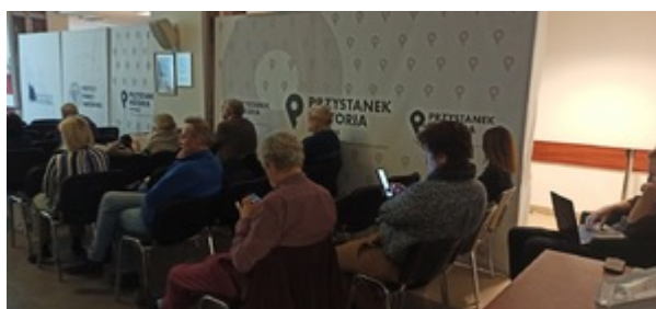
Ogólnopolska konferencja naukowa „II RP: cienie i blaski. Próba bilansu z perspektywy stulecia” – Warszawa, 8 listopada 2022