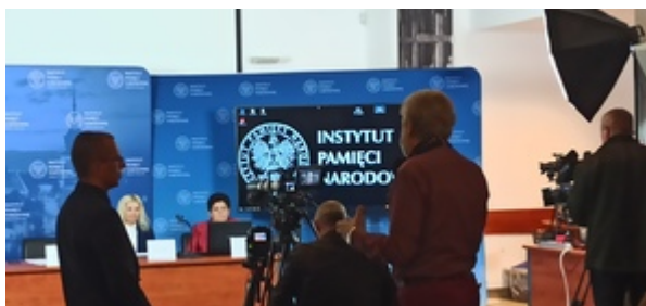
Ogólnopolska konferencja naukowa „II RP: cienie i blaski. Próba bilansu z perspektywy stulecia” - Warszawa, 8 listopada 2022