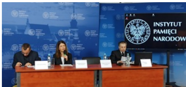
Ogólnopolska konferencja naukowa „II RP: cienie i blaski. Próba bilansu z perspektywy stulecia” - Warszawa, 8 listopada 2022

Oczywiście, w obu narracjach można odnaleźć realne zjawiska. Bohaterska i