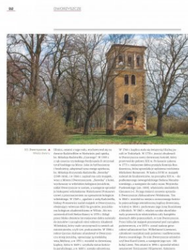
Strona z albumu „Kresowe rezydencje. Zamki, pałace i dwory na dawnych ziemiach wschodnich II RP”, t. 2: „Województwo nowogródzkie”