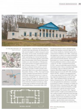
Strona z albumu „Kresowe rezydencje. Zamki, pałace i dwory na dawnych ziemiach wschodnich II RP”, t. 2: „Województwo nowogródzkie”