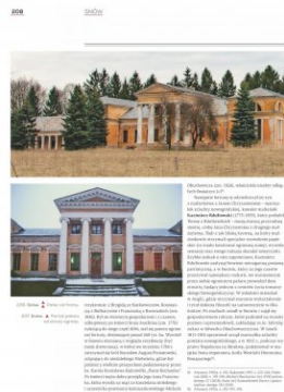
Strona z albumu „Kresowe rezydencje. Zamki, pałace i dwory na dawnych ziemiach wschodnich II RP”, t. 2: „Województwo nowogródzkie”