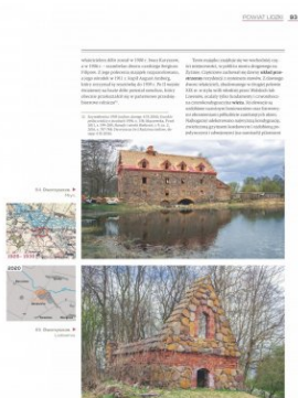
Strona z albumu „Kresowe rezydencje. Zamki, pałace i dwory na dawnych ziemiach wschodnich II RP”, t. 2: „Województwo nowogródzkie”