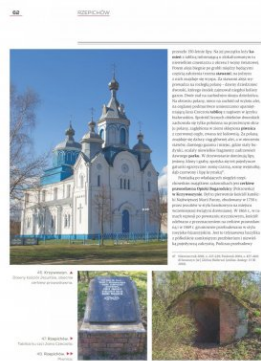
Strona z albumu „Kresowe rezydencje. Zamki, pałace i dwory na dawnych ziemiach wschodnich II RP”, t. 2: „Województwo nowogródzkie”