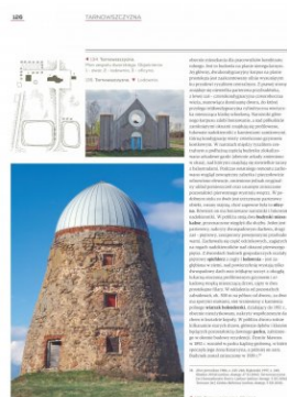
Strona z albumu „Kresowe rezydencje. Zamki, pałace i dwory na dawnych ziemiach wschodnich II RP”, t. 2: „Województwo nowogródzkie”