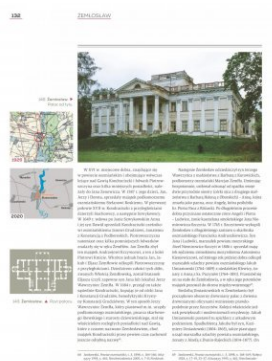
Strona z albumu „Kresowe rezydencje. Zamki, pałace i dwory na dawnych ziemiach wschodnich II RP”, t. 2: „Województwo nowogródzkie”