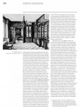
Strona z albumu „Kresowe rezydencje. Zamki, pałace i dwory na dawnych ziemiach wschodnich II RP”, t. 2: „Województwo nowogródzkie”