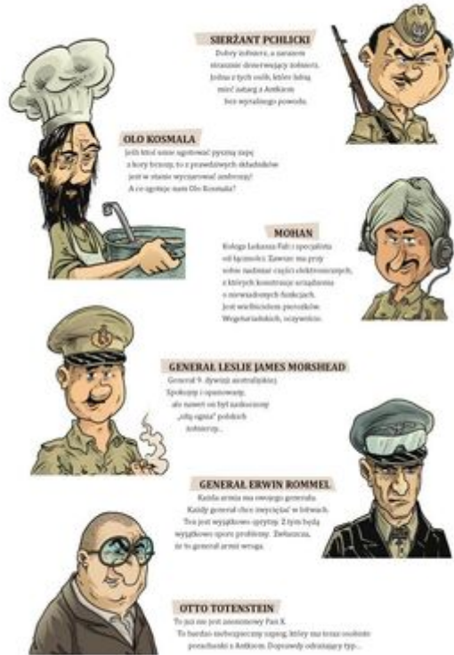
SIERŻANT PCHLIŃSKI Dobry żołnierz, a niezawodnie straszenie droższej walutą, niż żołnierz z tyłkami, które ledwo może ustąpić z Amikam bez sprytnego powodu.